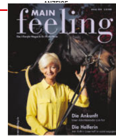
Magazin Mainfeeling 04/15

Limburg. 150 Jahre aktiv für Wirtschaft und Region – unter diesem Motto feiert die fast 13 000 Mitglieder starke Industrie- und Handelskammer (IHK) Limburg ihr rundes Jubiläum. mehr